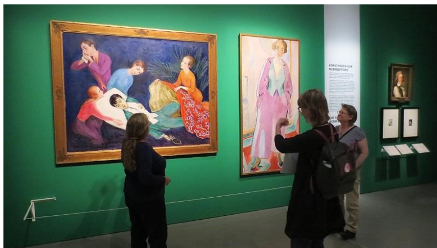
Vierailulla Konstnären -näyttelyssä Nationalmuseetin väistötiloissa.

Tukholmassa tutustuimme useisiin museoihin. Ensimmäisenä vierailimme Nationalmuseetissa, joka toimii remontin vuoksi väistötiloissa. Meille esiteltiin saavutettavuusratkaisuja mm. kuulemisen apuvälineitä ja näyttelytekstejä, jotka olivat tarjolla myös mukana kannettavana kirjasena. Nationalmuseetin näyttelyn aiheena olivat taiteilijat, ja esiin oli nostettu erilaisia taiteilijuuden ulottuvuuksia. Taiteilija on mm. matkailija, visionääri, edelläkävijä – ja normien murtaja. Näyttelytekstit saivat meidät innostumaan: heti ensimmäisessä salissa puhuttiin feminismistä ja tasa-arvosta sekä normien rikkomisesta. Teksteissä tuotiin esiin erilaisia identiteettejä ja tulkintoja. Saamelaisuudestakin saimme nähdä vilauksen, ja myös muualta Ruotsiin muuttaneet taiteilijat olivat päässeet ääneen taiteen tekijöinä.