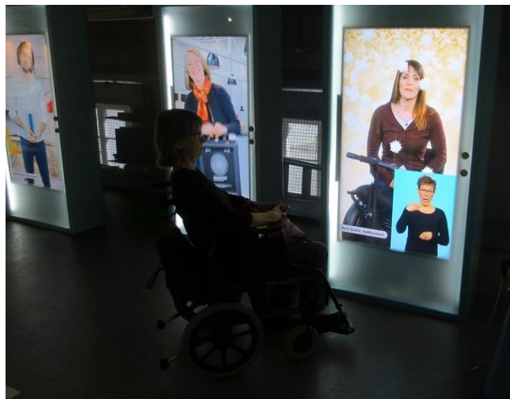
Yksi MegaMindin videotauluissa esitellyistä innovaattoreista käyttää pyörätuolia. Videoihin saa tietenkin viittomakielen tulkkauksen!

Ruotsissa toimii myös hanke Heterogena kulturarv, joka pyrkii tuomaan moninaisuusnäkökulmia kulttuuriperintötyöhön. Hankkeen mukaan museot saattavat helposti toistaa vallalla olevia tarinoita ja vahvistaa normeja. Museoita pidetään auktoriteetteina ja niillä on asiantuntija-asema. Ei ole olemassa neutraalia historiaa. Sen sijaan että museot kertoisivat että ”asia on näin”, ne voisivat tuoda esiin että näyttelyissä esitetyt näkökulmat ovat yksi näkemys monitulkintaisesta historiasta. Hankkeen mukaan kulttuurilaitokset ovat aina poliittisia toimijoita. Museot määrittelevät ihmisiä, kertovat tarinoita, joihin jotkut ihmiset otetaan mukaan, kun toiset jätetään ulos. Museoissa tehdään jatkuvasti valintoja sisällöistä ja tavoista esittää sitä. Jokaisen museotyöntekijän olisikin hyvä tiedostaa oma asemansa, oma valtansa ja oma identiteettinsä – ja samalla omat mahdollisuutensa ja museon työn merkitys yhdenvertaisuuden edistämisessä.