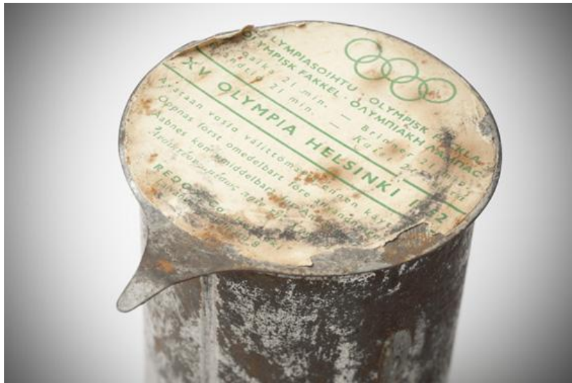
Soihdun maljaosan sisään vaihdettiin noin 20 minuutin välein uusi, geelimäistä palavaa ainetta sisältävä palopatruuna. Tarvittava määrä patruunoita jaettiin etukäteen kullekin viestipaikkakunnalle. Kannessa on käyttöohjeet suomeksi, ruotsiksi, tanskaksi ja kreikaksi.

Viestijärjestelyistä kirjoitetuista raporteista selviää, että soihdut olivat heikon tiedonkulun ohella koko soihtuviestin suurin murheenkryyni. Palopatruunan kiinnitysmekanismi meni helposti epäkuuntoon, jolloin patruuna joko juuttui maljan sisään tai soihtumaljan sisäosat yksinkertaisesti putosivat irti. Toinen syy patruunoiden juuttumiseen oli tina, jolla patruunoiden avaaja oli kiinnitettynä purkin kylkeen. Sulaessaan tina valui patruunasta maljaosan sisään ja aiheutti jäähtyessään patruunan jumiutumisen. Soihdunkantajan jäljessä ajaneessa huoltoautossa soihtuja oli siis korjailtava ja puhdistettava päivittäin.