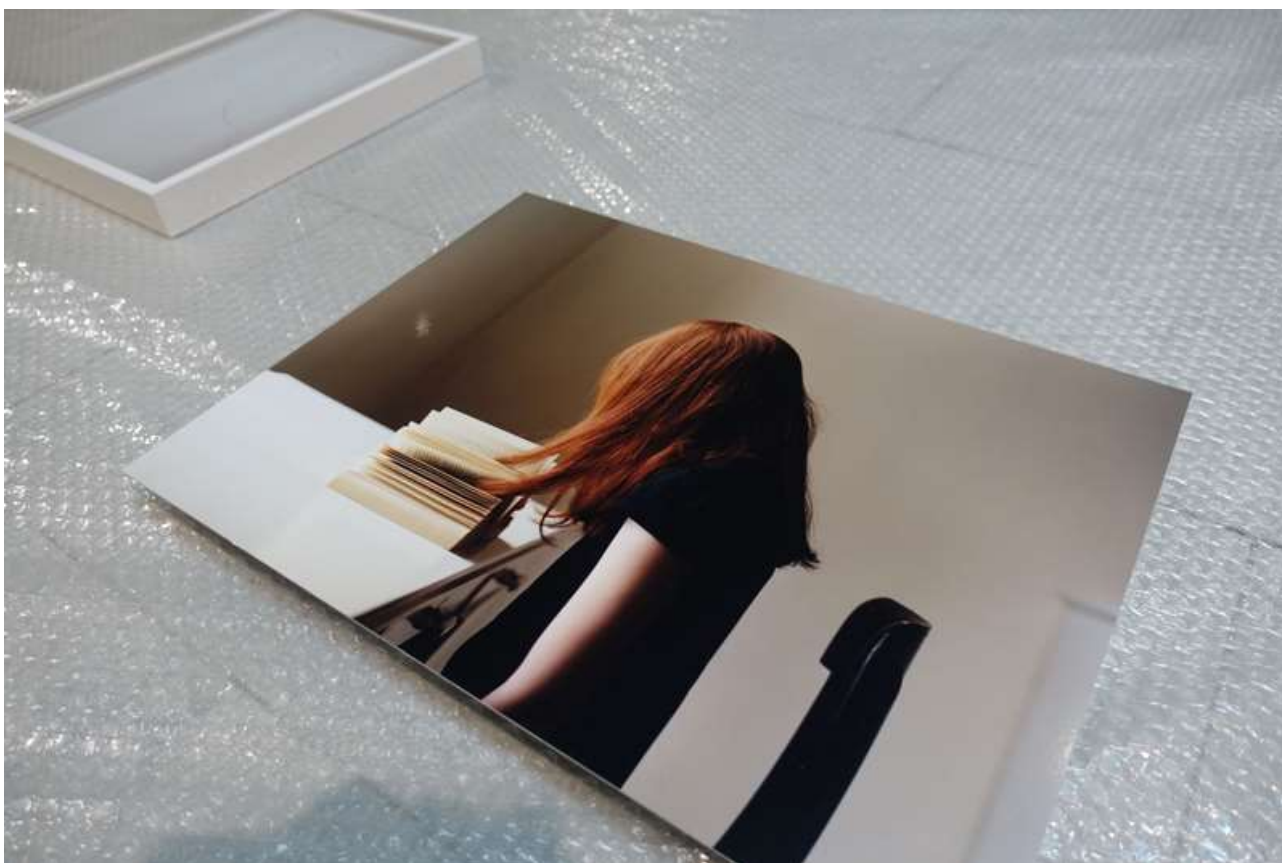
Anni Leppälän teos Reading (2010).

Helmikuussa 2019 järjestetty Taide ja kulttuuri osana kaupungin vetovoimaisuutta -seminaari käsitteli museoita sekä alueellista, valtakunnallista ja kansainvälistä taidetta ja taiteen yleisöjä. Seminaarin tavoitteena oli pohtia, millä tavoin museot voivat olla hyödyksi yhteiskunnan kehittämisessä tulevan vuosikymmen aikana, ja millaisia vaikutuksia niiden toiminnalla on kuntien elinvoimaisuudelle erityisesti pienemmissä kaupungeissa, kuten Porissa. Seminaari oli suunnattu kunnallisille kulttuuriorganisaatioille ja vapaan kentän toimijoille ja se toteutettiin osana Suomen kulttuurirahaston Museovisio-hanketta, jonka ensimmäisellä hakukierroksella Porin taidemuseolle myönnettiin avustus.