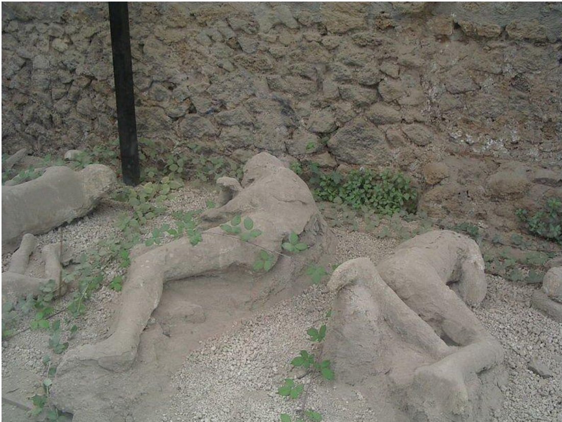
Tulivuoren purkauksessa hautautuneista ihmisistä tehtyjä kipsivaloksia Pompeijissa.

Historiantutkijoiden lisäksi joukkoon mahtui italialainen keittiömestari Giorgio Locatelli, joka on tutkinut mm. antiikin Rooman aikaista ruokakulttuuria. Hänen esittelemiensä löytöjen joukkoon kuului mm. kivettynyt leipä, jossa oli edelleen näkyvissä muinaisen leipurin leima. Puutarhuri Rachel de Thamen johdolla tutustuttiin antiikin Rooman puutarhoihin. Puutarhojen kauneuteen kiinnitettiin roomalaisissa kodeissa erityistä huomiota ja niitä koristeltiin freskoilla ja patsailla. Lopuksi katsojille esiteltiin se, mistä Pompeiji ja Herculaneum ovat tulleet kuuluisiksi, eli Vesuviuksen tulivuorenpurkaus, jonka uhreiksi kaupunkien asukkaat joutuivat vuonna 79 ajanlaskun alun jälkeen. Tämän purkauksen seurauksena tuhannet ihmiset hautautuivat laavavirran ja tuhkan alle. 1860-luvulla Pompeijissa keksittiin valaa kipsiä uhrien ruumiiden ympärille syntyneisiin onkaloihin. Siitä lähtien uhreista tehdyt kipsivalokset ovat kiehtoneet ihmisiä. Näitä valoksia nähtiin myös British Museumissa.