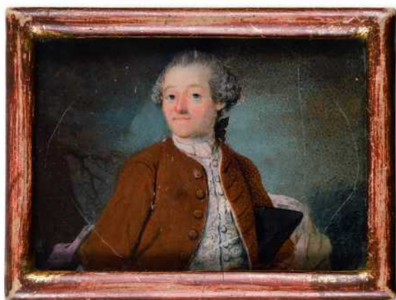
Kuva 4: Tuntematon ruotsalainen taiteilija, Miehen muotokuva, noin 1760-l, akvarelli ja guassi paperille. 5,5 x 7,6 cm (valomittaa). Henry Lönnforsin miniatyyrikokoelma, Turun taidemuseo. Kuva lehdistökuvaa.

Miniatyyrit nähdään taidemuseoympäristössä jännittävällä tavalla, tarkkarajaisina taideteoksina. Niitä ympäröivä käsin kosketeltava kulttuurihistoria, kehystys, häivytetään lähes näkymättömäksi. Vaikka pienoismaalauksille oli ominaista, että niitä käytettiin – nimenomaan käytettiin, museoituina niitä kuvaillaan litteinä maalauspintoina. Henry Lönnforsin kokoelman miniatyyreissä on ilmeisesti ollut (yhtä poikkeusta lukuun ottamatta?) kaikissa kehykset tai esimerkiksi korukäyttöön viittaavat ripustuslaitteet. Silti miniatyyreistä kerrottaessa niihin kiinnitetään niukasti huomiota.