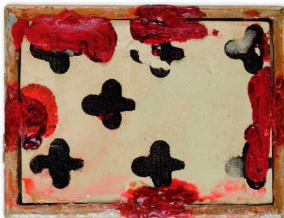
Kuva 5: Kääntöpuolella tukena pelikortti. Henry Lönnforsin miniatyyrikokoelma, Turun taidemuseo. Kuva lehdistökuvaa.