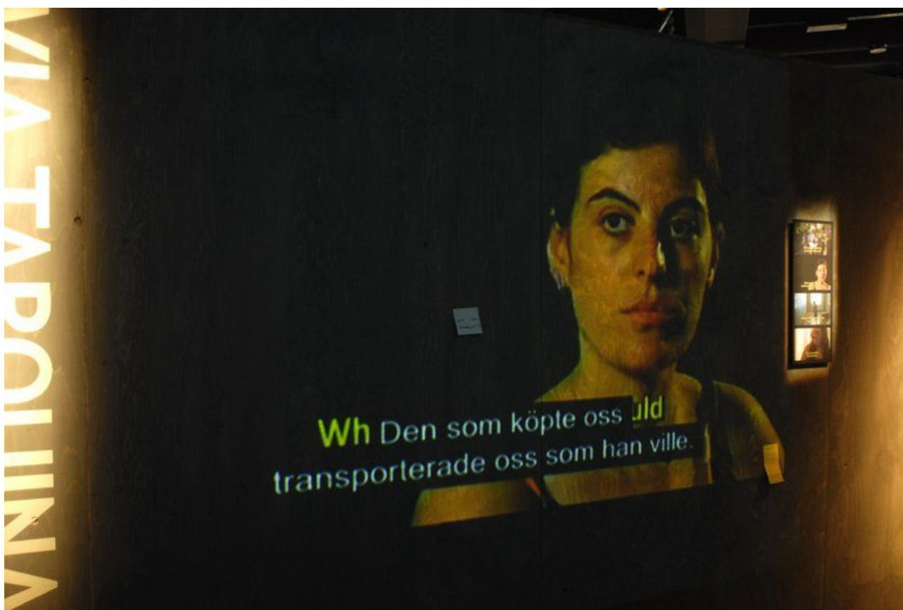
Kuva 3: Dokumenttifilmit antavat näyttelyssä puheenvuoron suoraan ihmiskaupan uhreille.

Haluaako Etnografiska Museet sanoa samalla, että ihmiskauppa on jo perinteinen ruotsalainen yhteiskunnallinen ongelma, osa tulevaisuuden kulttuuriperintöä? YK:n laskelmien mukaan maailmassa on vuosittain 600 000 – 4 000 000 ihmiskaupan uhria, joista Ruotsiin kulkeutuu noin 400 – 600 naista ja tuntematon määrä lapsia. Ainakin näiden uhrien menneisyyttä ihmiskauppa on. Myös ruotsalaisen yhteiskunnan todellisuutta se on rikollisuutena ja valokuvien todistamana ihmiskauppaa voi löytyä kenen tahansa kotirapusta, tavallisen oven takaa. Mutta yhdistäväksi identiteetin voimavaraksi ja miellyttäväksi, voimaannuttavaksi asiaksi siitä ei taida olla. Sellaiseksi, jota halutaan muistella, ja jonka varaan rakentaa käsitystä omasta itsestä ja ruotsalaisesta kulttuurista.