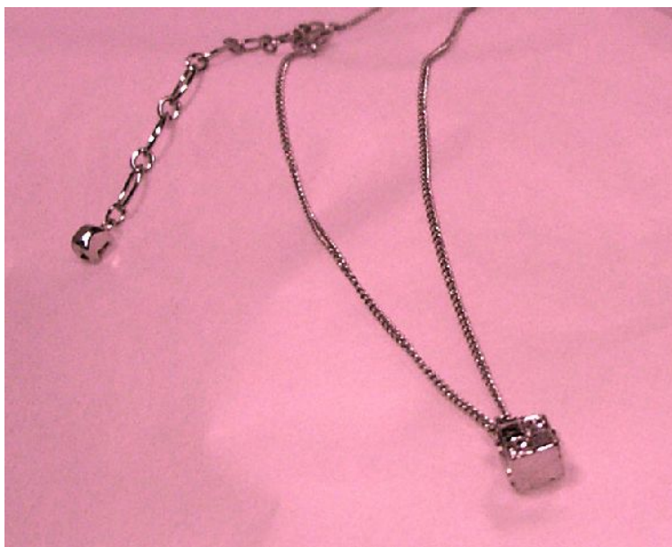
Kuva 1: Vuonna 2001 nuori nainen myytiin Albaniassa tämän hopeakaulakorun hinnalla. Kaupan jälkeen nainen kuljettiin kumiveneellä Etelä-Italiaan prostituoitavaksi. Poliisi kuitenkin nappasi salakuljetusjoukkion Italian rannikolla.

Esineiden taustalla olevat tarinat ovat kylmääviä, mikä tekee niiden vitriiniesittelystä jotenkin irvokasta ja samalla kävijälle haastavaa. Tällä kertaa kyseessä ei voi olla hurmaavan menneisyyden todistuskappaleiden ihaileminen lasin läpi. Näyttely muistuttaa enemmän oikeudenkäynnin todistusvaihetta, rikoksesta kertovan evidenssin erittelyä. YK:n raportit ihmiskaupasta saavat ruotsalaisen museon arvovallan syytöstenä tueksi ja museokävijä joutuu tahtomattaan todistajaksi.