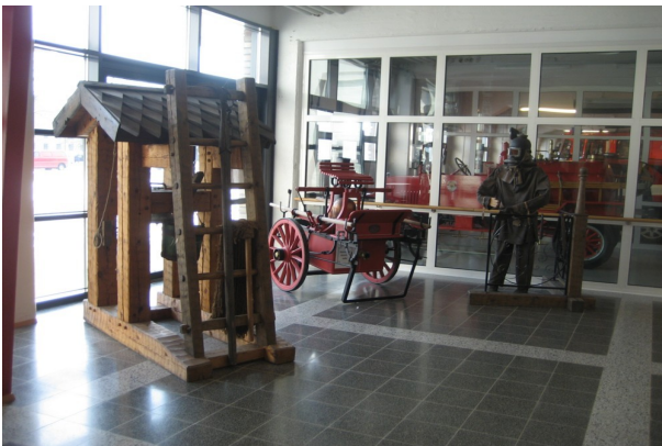
Kuva 2: Perinne-esineitä Kanta-Porin paloaseman aulassa. Esineiden taustalla lasiseinän takana näkyy edellisen kuvan auto entisöitynä.

Palomuseon perustaminen Poriin on ollut esillä silloin tällöin jo useamman vuosikymmenen ajan. Letkujen huoltotyön siirryttyä alueellistumisen myötä Porin keskuspaloasemalta Ulvilan paloasemalle Porissa vapautui noin sata neliötä tilaa, johon alettiin keväällä 2006 suunnitella palomuseota. Satakunnan pelastuslaitokselta otettiin yhteyttä Satakunnan Museoon ja pyydettiin museota välittämään alan opiskelija käynnistämään hanketta. Tässä vaiheessa minut palkattiin hankkeeseen museoassistentiksi. Museon toteuttamisesta käytyjen keskustelujen pohjalta todettiin, että museosta tehdään koko maakunnan pelastustoimen historiaa esittelevä. Museonäyttely valmistuu toukokuussa 2008.