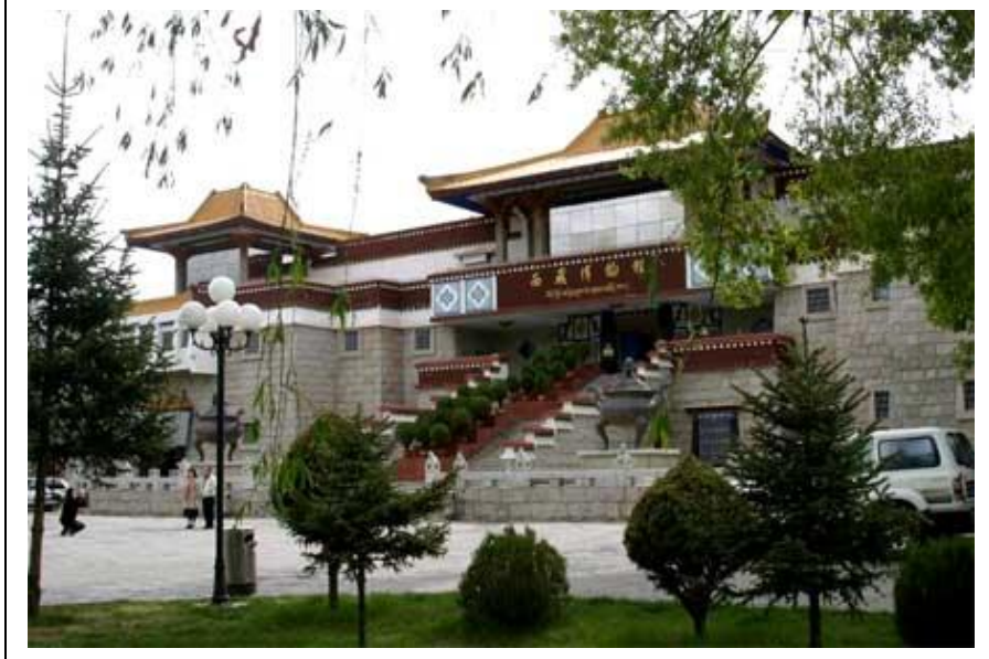
Tiibetin historian museo myötäilee Kiinan käsityksiä Tiibetin ”vapauttamisesta”. Yleinen sensuuri toimii Kiinassa edelleen tehokkaasti ja jopa oppaamme on yllätynyt siitä, että pidämme Tiibetiä kansainvälisesti tunnettuna paikkana.

Kiinan hallituksen suojeluksessa olevia luostareita on 5 kappaletta ja niille järjestetään henkilökunta, niitä johdetaan lähes poikkeuksetta ammattimaisesti ja niiden kunnosta huolehditaan. Kuitenkin jo nyt kasvavien kävijämäärien vaikutus alkaa näkyä niin henkilökunnan kuin huollonkin puutteena. Massat aiheuttavat painetta rakenteille ja toisaalta ovat epäsopivia pyhien kohteiden tunnelmaan. Tiibet-museo on hyvä esimerkki uudenaikaisen eli toisin sanoen länsimaisen museon saapumisesta Tiibetiin. On mielenkiintoista nähdä, miten turistikohdeita tullaan kehittämään ja ongelmia ratkaisemaan tulevaisuudessa – toivottavasti Tiibetin kulttuurin soveltuvalla tavalla.