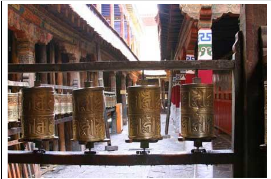
Rukousmyllyjä Johhang-temppelissä, joka on Potala-palatsin ohella toinen Tiibetin buddhalaisten tärkeimmistä pyhiinvaelluskohteista.

Jokhang-temppeli on toiminut rakentamisvuodestaan 639 lähtien pyhiinvaeltajien keskuspaikkana. Temppeli ympärillä kiertää vilkas Barkhor-kauppakatu, jota tulee kulkea myötäpäivään. Yhdessä Potalan kanssa, Jokhang ja Barkhor muodostavat UNESCO:n suojeleman historiallisen kokonaisuuden. Temppelin edusta sekä alttarit ovat täpötäynnä vierailijoita, mutta sivuosissa saimme kuljeskella melkein keskenämme. Paras paikka turistin kannalta on temppelin katto, josta aukeaa upea näköala kadulle, Lhasan vanhaan kaupunkiin sekä Potalan palatsiin.