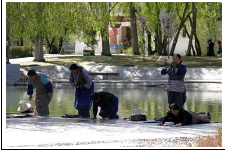
Pyhiinvaeltajia Potala-palatsin edustalla. Kumiset esiliina ja käsiineet suojelevat pyhiinvaeltajien ruumiinosia kulumiselta kumartelevaisen etenemisen aikana.

Jokhang-temppeli on toiminut rakentamisvuodestaan 639 lähtien pyhiinvaeltajien keskuspaikkana. Temppeli ympärillä kiertää vilkas Barkhor-kauppakatu, jota tulee kulkea myötäpäivään. Yhdessä Potalan kanssa, Jokhang ja Barkhor muodostavat UNESCO:n suojeleman historiallisen kokonaisuuden. Temppelin edusta sekä alttarit ovat täpötäynnä vierailijoita, mutta sivuosissa saimme kuljeskella melkein keskenämme. Paras paikka turistin kannalta on temppelin katto, josta aukeaa upea näköala kadulle, Lhasan vanhaan kaupunkiin sekä Potalan palatsiin.