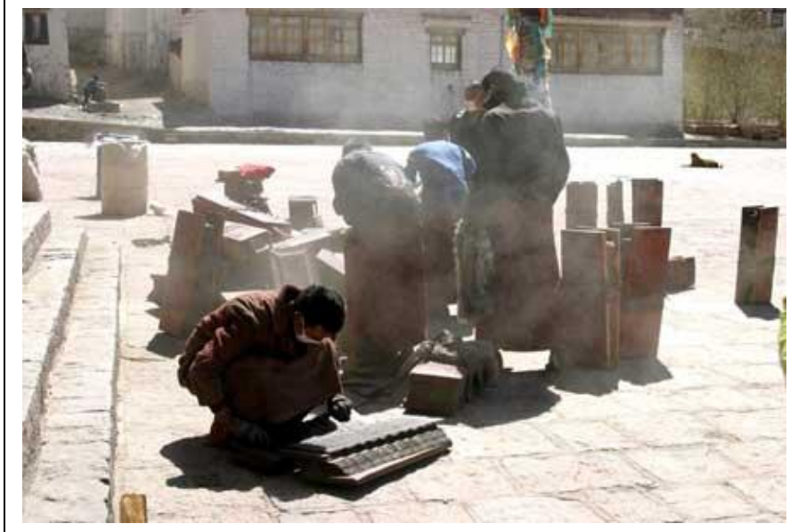
Palcho-luostarin munkit siivouspuuhissa. Satoja vuosia vanhoja pyhiä kirjoituksia tomutetaan reippaasti pihamaalla.

Ennen lentokentälle lähtöä sunnuntaina ehdimme vielä vierailta sekä dalai-laman kesäpalatsin alueella, Norbulinkassa sekä Tiibet museossa. Kesäpalatsin alue on suuri, lähes luonnontilassa oleva puistoalue, josta löytyy kulloisenkin dalai-laman kesäasunto. Puiston rakennutti seitsemäs dalai-lama 1750-luvulla. Yleisölle avoinna ovat pääasiassa vain palatsien edustusosat eli vastaanottohuoneet. Syynä tähän on sekä yksityisosien suojeleminen että resurssipula. Yksityiset osat ovat auki vain erikoistapauksissa. Neljännentoista dalai-laman palatsissa pääsemme poikkeuksellisesti kurkistamaan hänen varsin moderniin kylpyhuoneeseensa sekä hänen äitinsä vastaanottohuoneeseen. Esillä on myös valtaistuin, jonka edessä olevaan lippaaseen kävijä voi jättää lahjoituksensa.