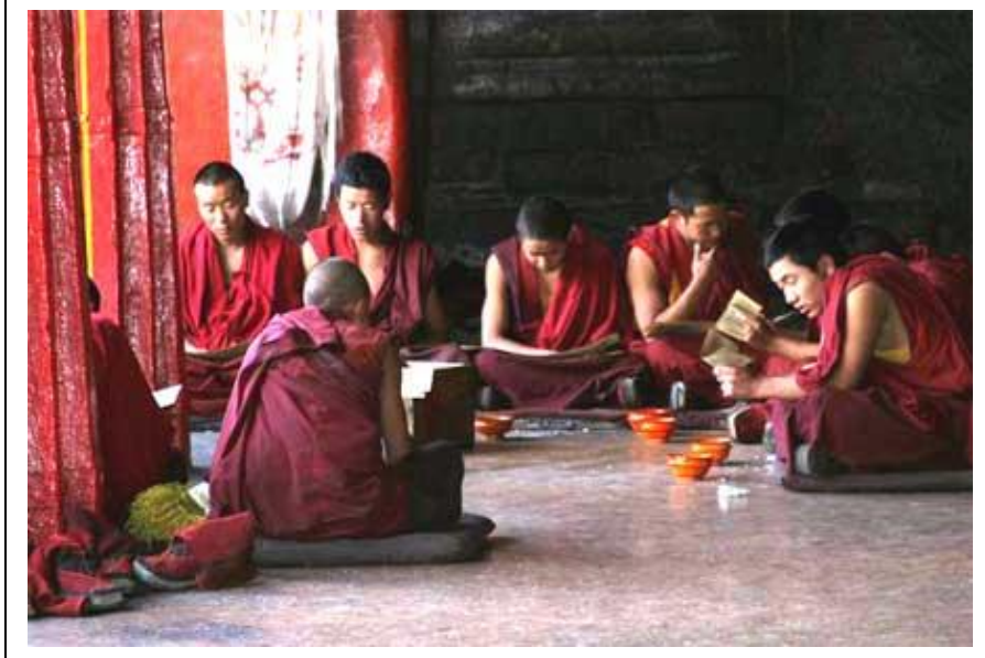
Munkit opiskelevat Tashilumpossa pyhiä kirjoituksia turisteista ja salamavaloista juurikaan välittämättä.