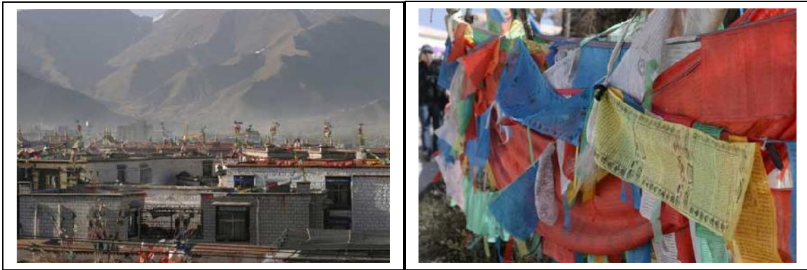
Näkymä Lhasan kattojen yli. Rukousliput suojelevat talossa asuvia perheitä. Rukouslippuja voi Tiibetissä löytää korkeimman ja vaikeakulkuisimmankin vuoren huipulta. Väreissä punainen symboloi valtaa, valkoinen puhtautta ja keltainen pyhää. Ulkopuolisesta lippujen ajoittainen paljous etenkin luontokohteissa tuntuu lähinnä roskaamiselta.

Juna osoittautui hienoksi ja moderniksi ja hytit yllättävän tilaviksi. Soft sleeper -osasto oli täynnä länsimaalaisia sekä varakkaalta vaikuttavia kiinalaisia. Tavallinen Kiinan kansalainen matkusti joko avoimissa hard sleeper- tai istumaosastoissa. Parasta hytissä oli valtava ikkuna, josta saatoimme ihastella vaihtuvia maisemia 4000 kilometrin varrelta. Matkan aikana ikkunan ohi vilahtelivat maalauskylät, kaupungit, aavikot kuivine joenuomineen, viljavat keltaiset peltotilkkutäkit, autiokylät vuorten syleilyssä, kirkkaat vuoristojärvet, rinteillä laiduntavat jakit paimenineen ja sadat muut ihmettelynaiheet. Kylien ja kaupunkien tunnistamista helpotti englannin- ja kiinankielinen opastus keskusradiossa. Toisena matkapäivänä hytteihin alettiin pumpata lisähappea ja aloimmekin jo tuntea oireita korkean ilmanalan johdosta. Päätä hieman särki, väsytti ja hengästytti. Sen enempää oireita emme koko matkalla saaneetkaan, joten pääsimme helpolla. Hitaasti 5000 metriin kohoava juna oli varmasti syynä tähän, lentokoneella lennettäessä oireet olisivat olleet todennäköisesti pahempia. Pekingistä lähdimme matkaan sunnuntai-illalla ja perillä Lhasassa olimme tiistai-illalla. Ilma oli lämmin ja kostea.