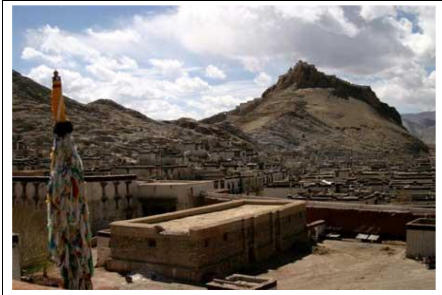
Näkymä Palcho-luostarista kaupunkiin. Gyantse on Tiibetin neljänneksi suurin kaupunki ja kuuluisa brittiläisiä valloittajia vastaan käymästään taistelusta vuonna 1904. Onnenamuleteilla aseistettuja brittiläisiä joukkoja vastaan käyneet kaupunkilaiset pitivät pintansa jopa kaksi viikkoa. Taistelun vuoksi Gyantsea kutsutaan myös "sankareiden kaupungiksi".

Lauantaina suuntasimme kohti Gyantsea ja vuonna 1440 perustettua Palcho-luostaria. Luostarin erikoisuutena on kolmen eri buddhalaisuuden lahkon kokoontuminen samaan pihapiiriin. Luostariin saavuttuamme huomasimme riemuksemme munkkien olevan pihalla siivouspuuhissa. Sankka pölypilvi ympäröi kymmeniä vanhojen kirjoitusten tomuttajia. Oppaamme valisti meitä paperin vahvuudesta – paperi käsitellään kuulemma ”lääkkeellä”, joka pitää tuholaiset poissa sekä pidentää käyttöikää. Vanhoilta kirjat näyttivätkin, mutta vaikutuksensa saattaa olla myös päivittäisellä käytöllä sekä ympäristökäytöllä. Kiinassa useimmat temppelit sekä palatsit pitävät ovensa auki läpi vuoden altistaen sisuksensa vuodenaikojen vaihteluille tarkoittaen ajoittain joko äärimmäistä kuivuutta tai kosteutta. On selvää, että Kiinassa alkuperäisen merkitys ei ole sama kuin länsimaissa, vaan alkuperäisyys käsitetään enemmänkin samanlaisuutena. Esine on käytännössä sama vaikka se olisikin alkuperäisen kopio, sen kaikki osat olisi käytännössä vaihdettu ja/tai se olisi maalattu useasti vuosien aikana. Esineen merkitys tulee pääasiassa sen käytöstä – esine on aito niin kauan kuin sitä käytetään alkuperäiseen tehtäväänsä.