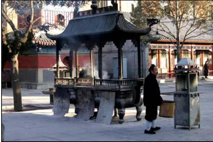
Taolaiset munkit polttavat kävijöiden lahjoittamia suitsukkeita. Temppele on pekingiläisille tärkeä etenkin kiinalaisen uuden vuoden (18.-19.2.) aikaan, jolloin sinne kokoonnutaan juhlimaan ja varmistamaan hyvää onni tulevaksi vuodeksi.