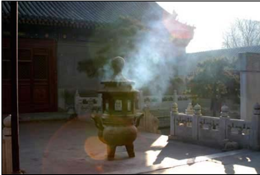
Valkoisten Pilvien temppeli on rauhan ja taolaisuuden tyysija keskellä vilkasta kaupunkia. Rakennukset ulottuvat vanhimmillaan Qing-dynastian aikaan 1300-luvulle. Ensimmäinen temppeli paikalle perustettiin jo 700-luvulla, mutta muiden Kiinan temppelien tavoin, se on tuhottu monta kertaa vuosien saatossa. Kuva: Lehtokari 2006.

Lakeja kulttuurin suojelemiseksi säädetään koko ajan, mutta Kiinalle tyypillinen raskas byrokraatia, korruptoituneisuus, bisneskeskeisyys sekä virkamiesten välinpitämättömyys ovat asioiden etenemisen esteenä. Kaikki täällä tapahtuu hyvin hitaalla aikataululla – jos ollenkaan – ja nopeiden muutoksien keskellä kaikkia kulttuurikohteita ei välttämättä ehditä pelastaa. Asioiden täytyy kuitenkin täällä edetä tarkan järjestyksen mukaisesti ja toivoa ei ole, ennen kuin asioiden tärkeysjärjestystä saadaan muutettua. Tämä ei tietenkään ole vierasta muuallakaan päin maailmaa. Positiivista on kuitenkin se, että kiinnostus kulttuuria ja sen suojelua kohtaan on alkanut kasvaa niin viranomaisten, yhdistysten kuin yksityishenkilöidenkin keskuudessa. Niin kiinalaisille kuin ulkomaisillekin suunnattuja erilaisia ei-valtioliitännäisiä yhdistyksiä syntyy jatkuvasti, näistä hyvänä esimerkkinä itseään Kiinan suurimmaksi kansalaisjärjestöksi markkinoiva ”Beijing Cultural Heritage Protection Center”, jonka sivustoilla voi seurata monien aineellista sekä aineetonta kulttuuriperintöä koskevien hankkeiden ja suojelutyön edistymistä. Myös Pekingin kaupungin toiminta vanhan alueen suojelemiseksi on ollut jotain ennennäkemätöntä. Puskurivyöhykesuunnitelman lisäksi kaupunki sijoitti vuonna 2000 kolmesataakolmekymmentä miljoonaa yuania historiallisten kohteiden suojelutyöhön, mikä on suurin summa Kiinan historiassa.