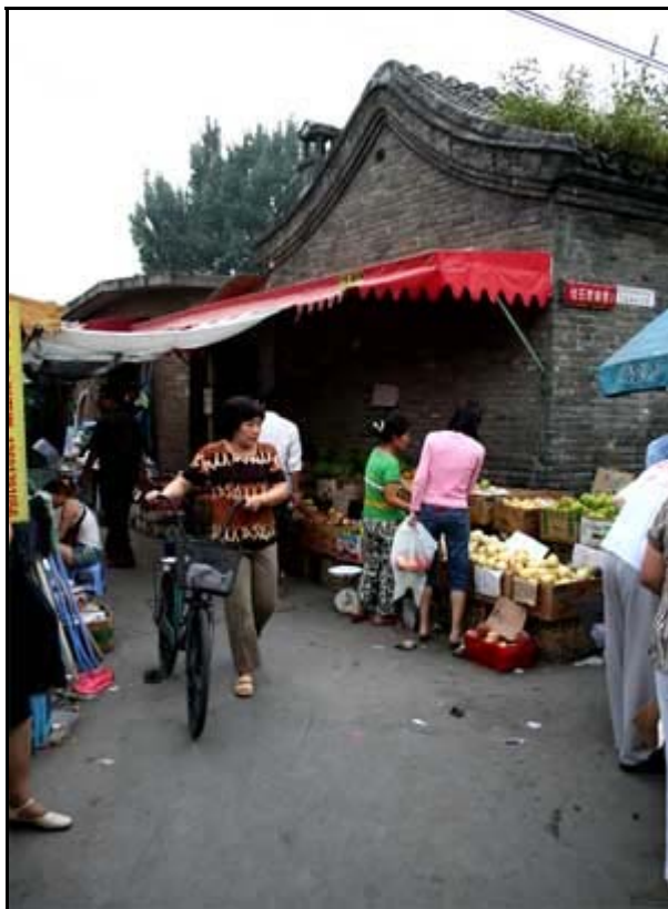
Pekingin hutongien nykypäivää.