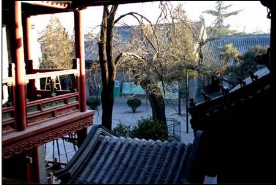
Valkoisten Pilvien temppelin muurien keskelle eivät liikenteen äänet ulotu. Suljetun pihan tunnelmaa.

”Vanhan Pekingin” alue sisältää hengästyttävän kauniita paikkoja, joiden vehreiden pihojen keskellä ja vankkojen muurien takana ajankulu kirjaimellisesti pysähtyy. 15 miljoonan ihmisen ja miljoonien autojen kaupungissa tarvitaan tällaisia hengähdyspaikkoja, joten suojelutyö vanhan keskustan säilyttämiseksi jatkuu. Toivottavaa toki olisi, että innostus laajenisi kattamaan koko kaupungin eikä vain keskusta-alueita. Tuntematon ei ole myöskään alueisiin liitetty ja myös muualla maailmassa tuttu ilmiö: romantisoiminen. Alueella asuvat ihmiset elävät kurjissa oloissa ilman juoksevaa vettä, elintilaa (yhdessä pienessä huoneessa saattaa asua 4-5 ihmistä) tai muita nykyajan mukavuuksia. Turisti luonnollisesti nauttii tästä "aitoudesta", mutta on selvää, että asiat tulevat muuttumaan. Suurin haaste onkin yhdistää kasvavan kaupungin, asukkaiden ja turismin toiveet ja tarpeet. Miten Peking tämän suuren haasteen toteuttaa, on yhä hämärän peitossa. Mutta mikäli olympialaisista selvittää kunnialla, mikään ei liene enää tälle kaupungille mahdotonta.